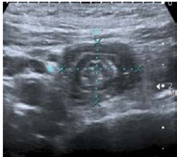
Figura 1 Corte transversal en la región periumbilical.